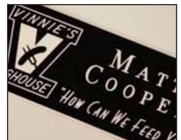
Identificadores de solapa