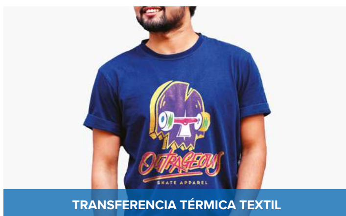
TRANSFERENCIA TÉRMICA TEXTIL