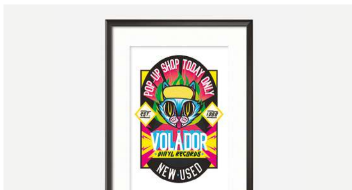
RÓTULOS Y CARTELES