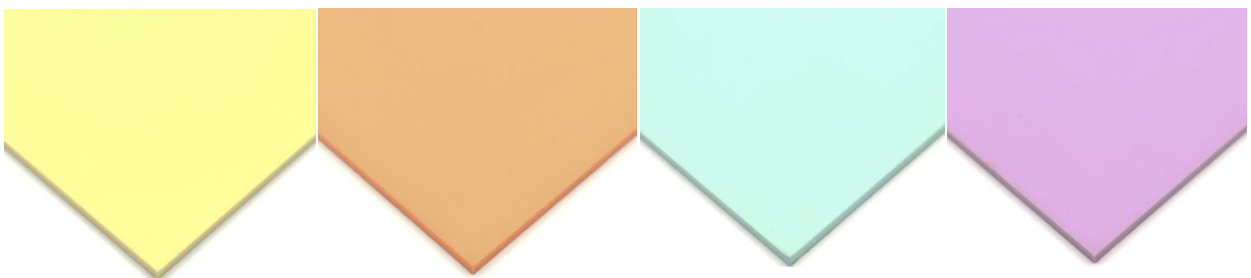
PLX2170 3MM AMARILLO