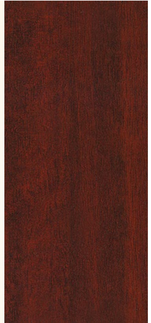
etimoe caoba brillo PH05702F 5MM