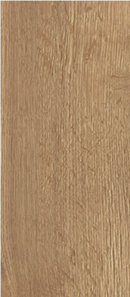
roble natural PH03802 3MM