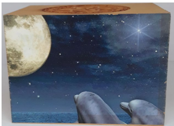
Bloque con impresión directa tinta UV

Trofeos, conmemoración, impresión de fotografías, grabado de menús, pequeña rotulación de sobremesa, proyectos creativos y de decoración.