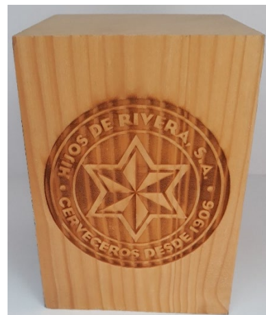
Bloque grabado a láser