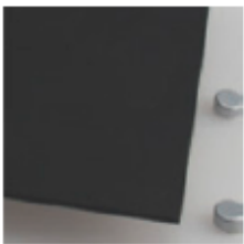
Negro (mate 1 caras) 3 mm / Opaco PLX6X3 3N

Gama PLX6X3 opaco tamaño plancha 600 x 280 mm