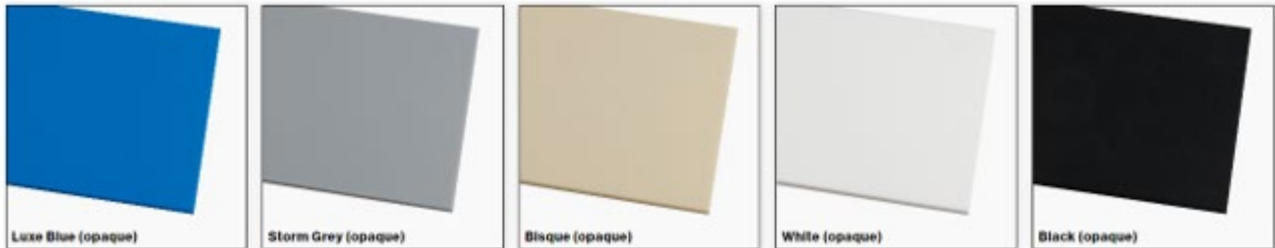
Luxe Blue ROW CH341-571

Gama PLX6X3 opaco tamaño plancha 1232 x 613 x 1,6 mm