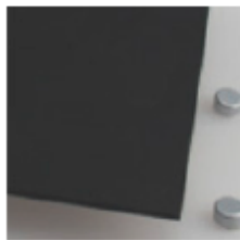
Negro (brillante 2 caras) 4 mm / Opaco PLX6X3 4N