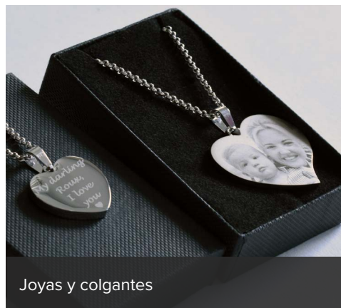
Joyas y colgantes