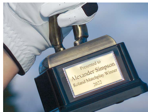
Grabado en trofeos