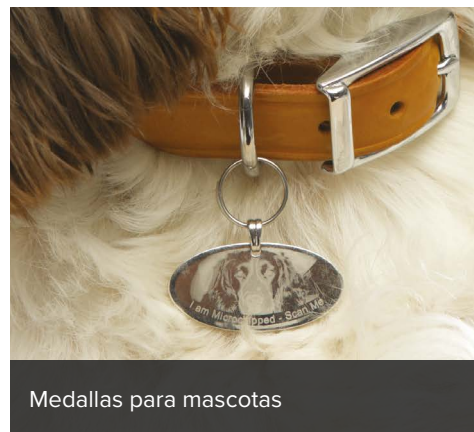
Medallas para mascotas